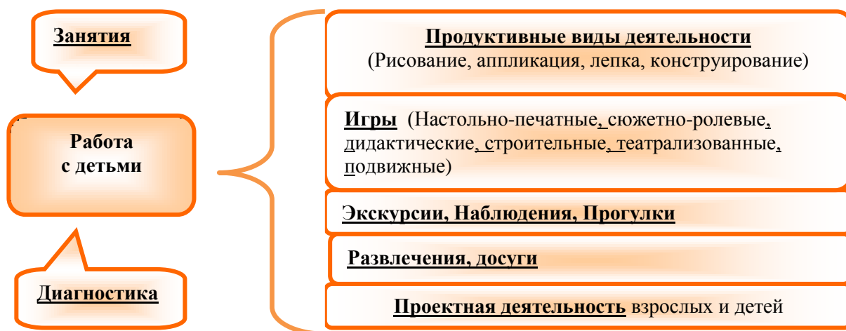
Рис. 1 Формы работы с детьми по обучению ПДД

В течение дня во всех возрастных группах предусмотрен определенный баланс различных видов деятельности.