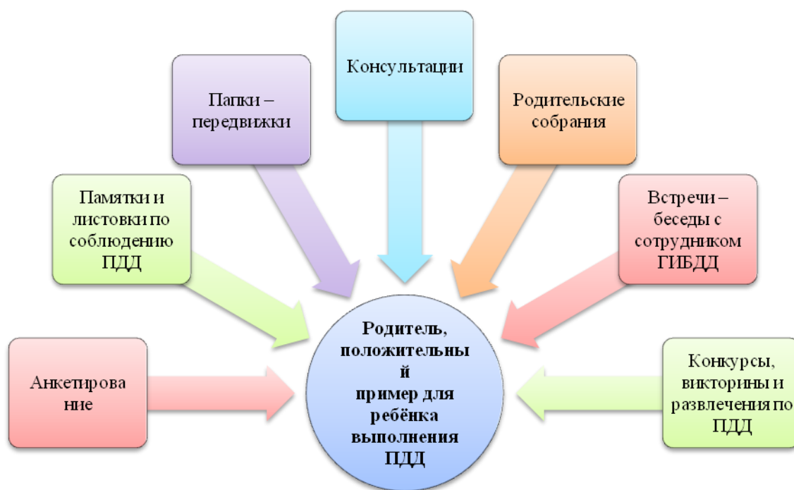
Рис. 2 Основные направления и формы работы с семьей

Определяющей целью разнообразной совместной деятельности в триаде «педагоги-родители-дети» является удовлетворение не только базисных стремлений и потребностей ребенка, но и стремлений и потребностей родителей и педагогов.